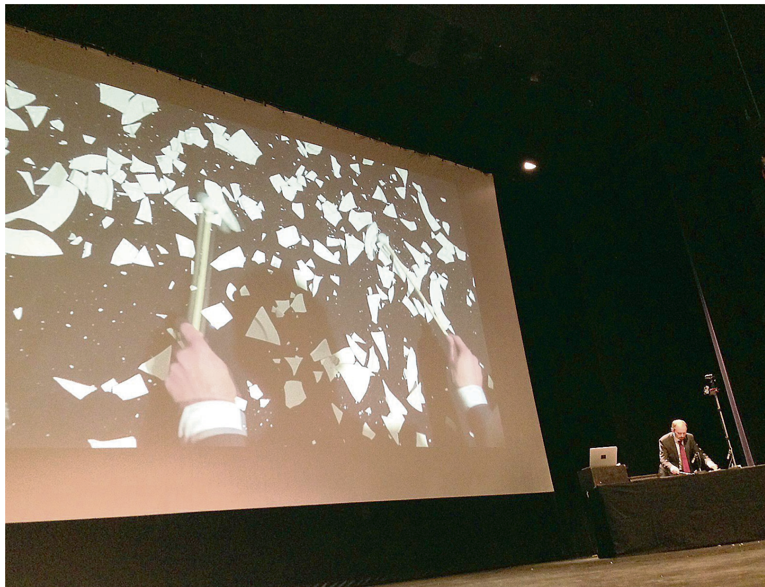
FRA FORESTILLINGEN: «Det fantes en tid da kombinasjonen «Nord-Norge» og «kultur» var synonymt med opprør, klassekamp og drømmer om en annen tid (da ingen folk e fattige og rike). I dag framstår Nord-Norge som møblert, velartikulert, oljesmurt og fornøyd med tingenes tilstand».

I avviksmeldingen skriver ledelsen for legevakten at hendelsen er et eksempel på noe som flere ganger har skjedd, og som viser til for lang utrykningstid ved farlige situasjoner.