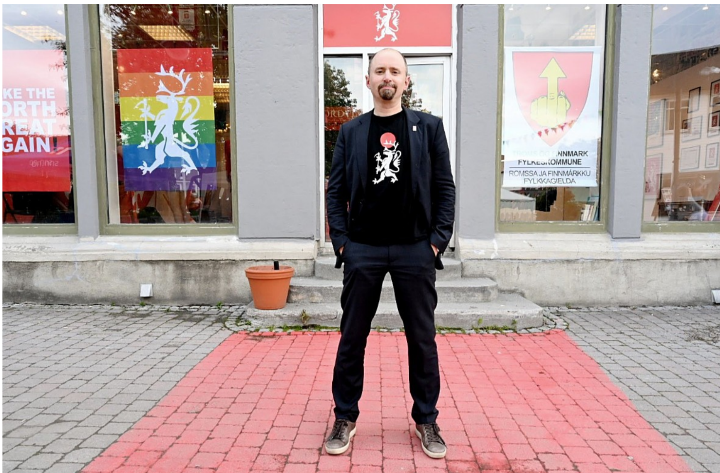
← Kunstner Asmund Sveen arrangerer bussturer for å vise hvordan de rikeste bor